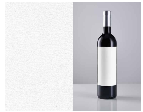
Fasson® Cotton Touch Craft FSC