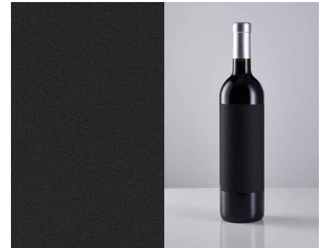
Fasson® Cotton Black