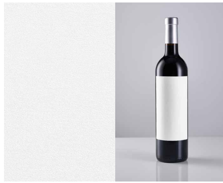
Fasson® Cotton Touch FSC