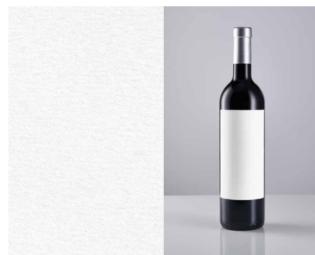
Fasson® Cotton Touch Craft FSC