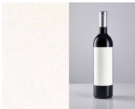
Fasson® Cotton Extra White