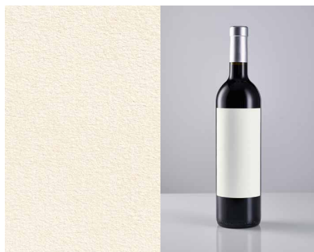
Fasson® Cotton White