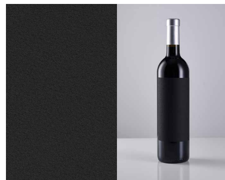
Fasson® Cotton Black