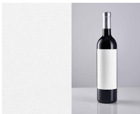
Fasson® Cotton Touch FSC

La sensazione di lusso che appartiene alla natura