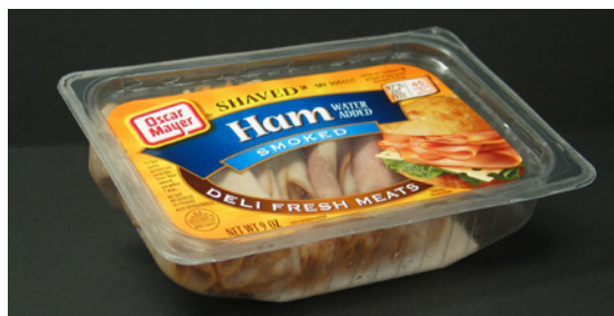
Soluciones para la decoración de envases termoformados

Etiqueta Libro con ideas de recetas para agregar valor al producto