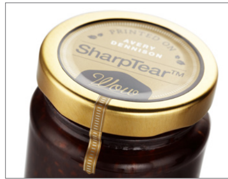
Etiquetas con sello de seguridad que ofrecen evidencia de adulteración